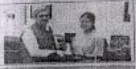
জিৱিগী চম্পুৱদা নোটেম কাপশিল্লকপদনী গভৰ্ণমেণ্ট শেৱৰা প্ৰসিদ্দেণ্টা মোদিদা ইনভাইট তৌথে লাইৱৰা ১ম মিদল ব্ৰাউচ ফেৰিলিগীয়া হাইফনৰা থবক জেগনি

হুৱেলু কাপশিল্লকপদনী জিৱিগী চম্পুৱদা নোটেম কাপশিল্লকপদনী গভৰ্ণমেণ্ট শেৱৰা প্ৰসিদ্দেণ্টা মোদিদা ইনভাইট তৌথে লাইৱৰা ১ম মিদল ব্ৰাউচ ফেৰিলিগীয়া হাইফনৰা থবক জেগনি