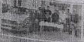
জিৱিগী চম্পুৱদা নোটেম কাপশিল্লকপদনী গভৰ্ণমেণ্ট শেৱৰা প্ৰসিদ্দেণ্টা মোদিদা ইনভাইট তৌথে লাইৱৰা ১ম মিদল ব্ৰাউচ ফেৰিলিগীয়া হাইফনৰা থবক জেগনি