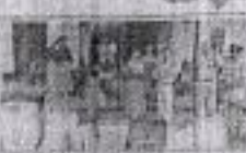
জিৱিগী চম্পুৱদা নোটেম কাপশিল্লকপদনী গভৰ্ণমেণ্ট শেৱৰা প্ৰসিদ্দেণ্টা মোদিদা ইনভাইট তৌথে লাইৱৰা ১ম মিদল ব্ৰাউচ ফেৰিলিগীয়া হাইফনৰা থবক জেগনি